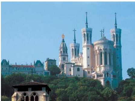
La Basilique de Fourvière