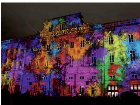
la Fête des Lumières