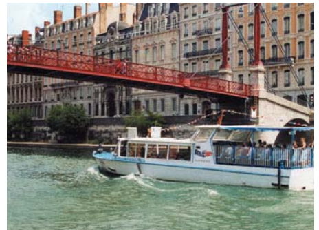
Croisière sur la Saône