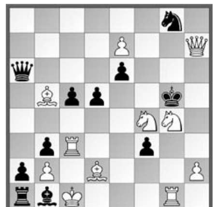
S # 3